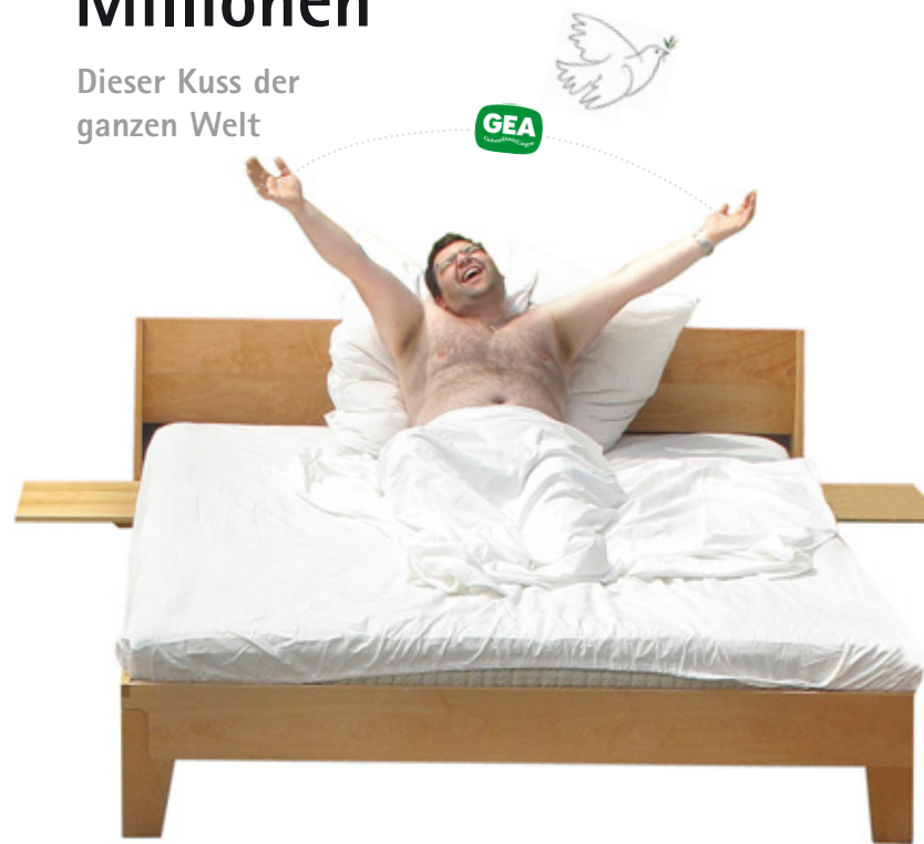
Fred & Frieda: Betrahmen exkl. Haupt, Einstecktischchen, Matratze, Bettwäsche und unserem Mitarbeiter Hamster.