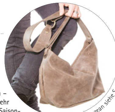
Koko in flachs. Koko in ozean siehe Seite 9

Waldviertler Schuhe in allen Saison- und Standardfarben auf www.gea.at und in den GEA-Läden