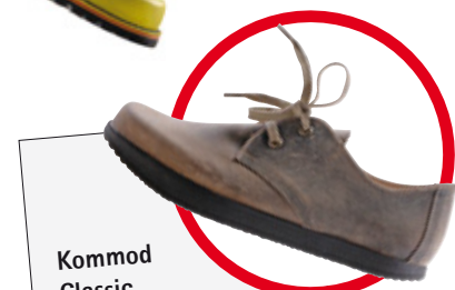
Kommod Classic Aufrecht gehen. Aufrecht stehen. Im Lexikon, Seite 21

Klaxianer sind sich einig, dass es sich bei Klax und Klox (Lexikon Seite 21) um Allwetterschuhe handelt. Leo, unser Doc, weiß, dass dagegen kein Kraut gewachsen ist und empfiehlt sie in der feschen Saisonfarbe lemon mit und ohne Socken. Saisonfarbe lemon. Größen 35–48 € 125,—